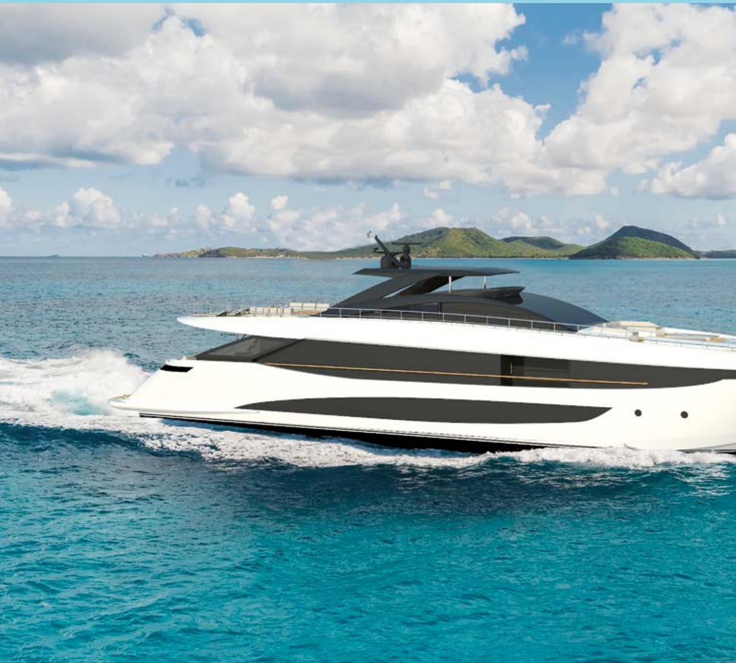
Amer Yachts 120